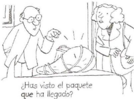
¿Has visto el paquete que ha llegado?