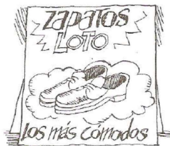
Zapatos Loto, los más cómodos .