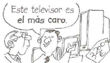
Este televisor es el más caro . (de todos los televisores de esta tienda)