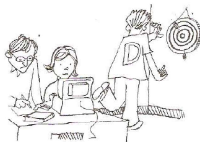
David es el menos trabajador de sus amigos.

La más alta , los más cómodos , el menos trabajador son formas de superlativo. Se usan para comparar a alguien o algo con un grupo.